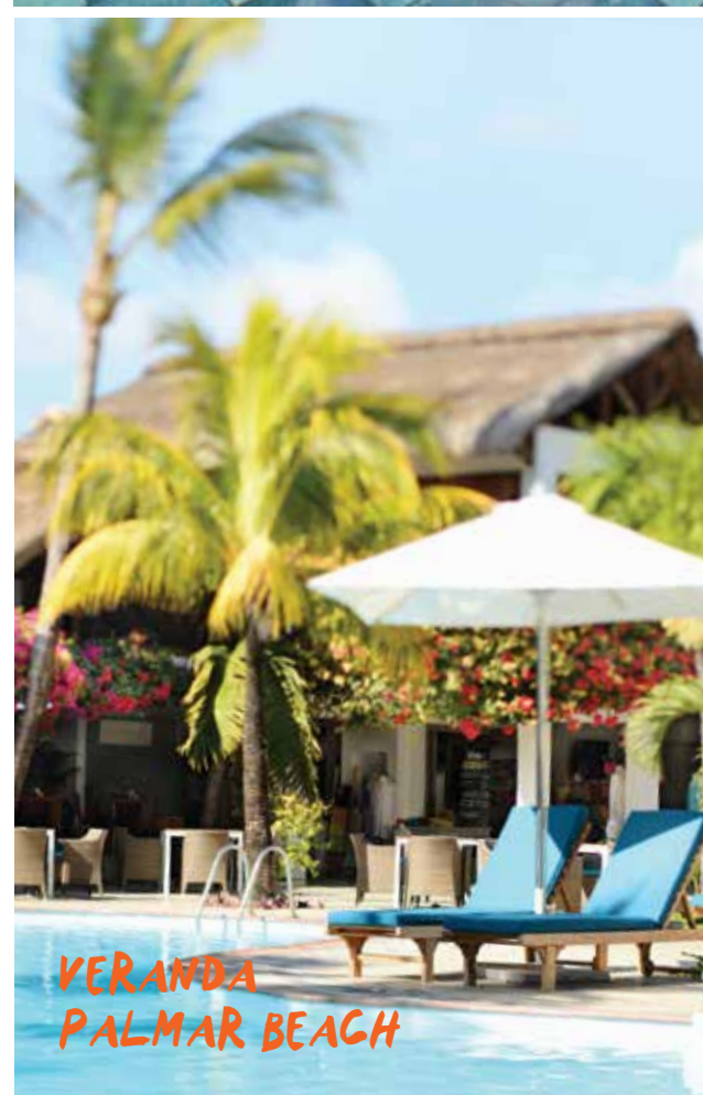
VERANDA PALMAR BEACH