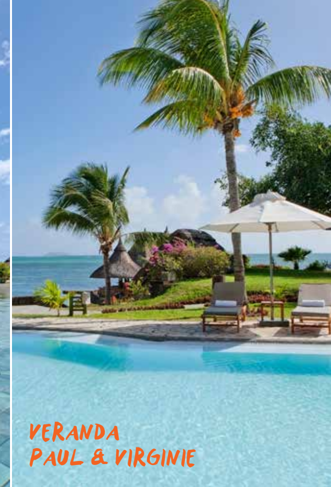
VERANDA PAUL & VIRGINIE