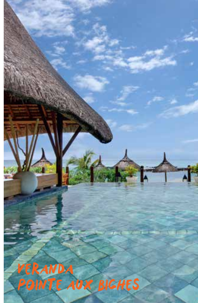
VERANDA POINTE AUX BICHES

Veranda Resorts: 30 ans d'expertise dans l'art de vivre mauricien. Plongez au cœur de l'île Maurice et embrassez l'atmosphère pétillante des lieux.