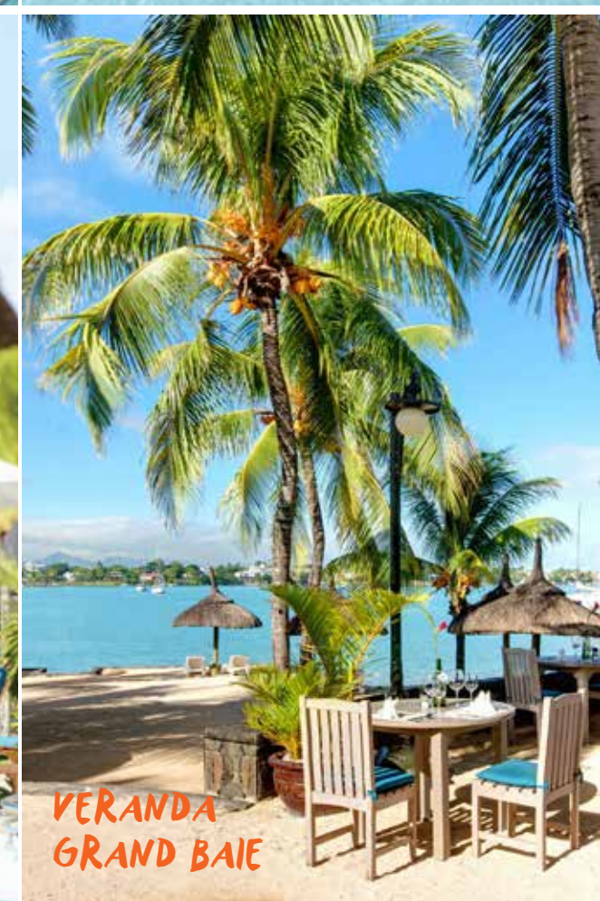
VERANDA GRAND BAIE